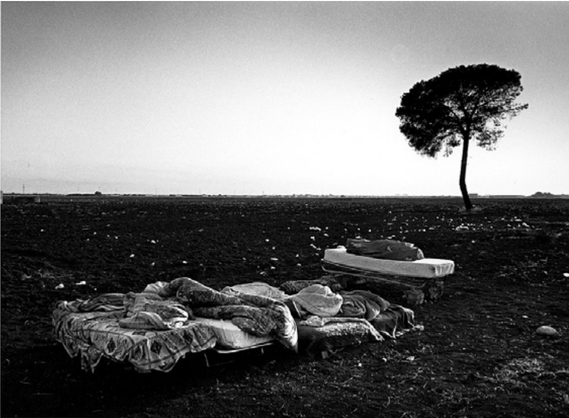
Fotografia di Nicola Spadafranca

La Scuola di Paesaggio intende prendere in esame i più significativi flussi migratori che sul lungo periodo hanno interessato le campagne italiane, tradottisi sia in fenomeni di abbandono che, viceversa, in processi di neopopolamento e/o di ritorno, osservando come il paesaggio si sia trasformato in relazione ad essi. Non solo il paesaggio agrario in senso stretto, ma anche il paesaggio sociale, quello del lavoro e degli stili di vita, il paesaggio culturale, con uno sguardo anche all’impatto sui paesaggi urbani.