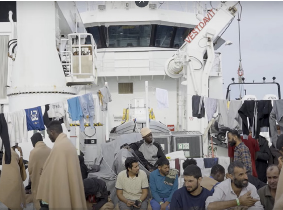
Fotogramma del filmato Dentro la rotta migratoria più pericolosa del mondo