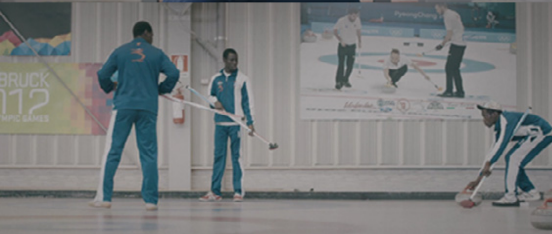
Fotogramma del film ICE